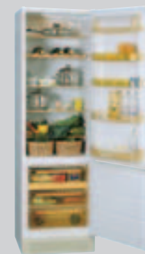
ER 9198 BSAN