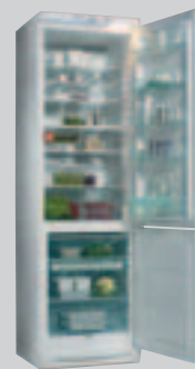
ER 9192 B