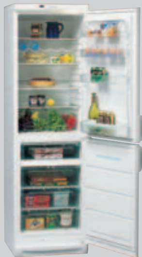
ER 8992 B